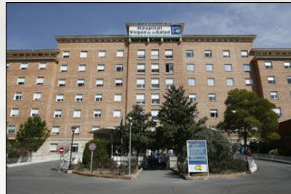
Hospital Virgen de la Salud